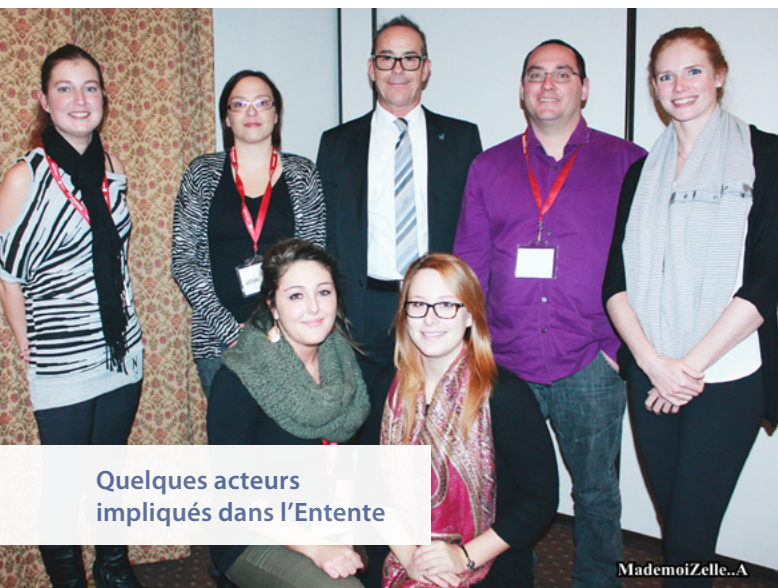
Quelques acteurs impliqués dans l'Entente