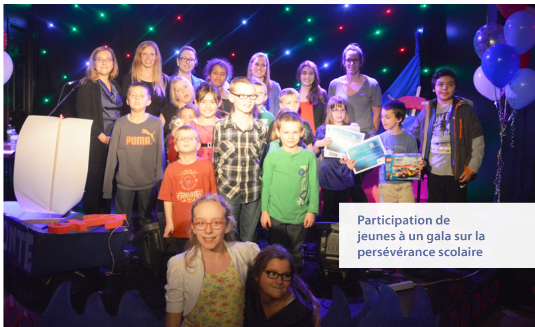
Participation de jeunes à un gala sur la persévérance scolaire