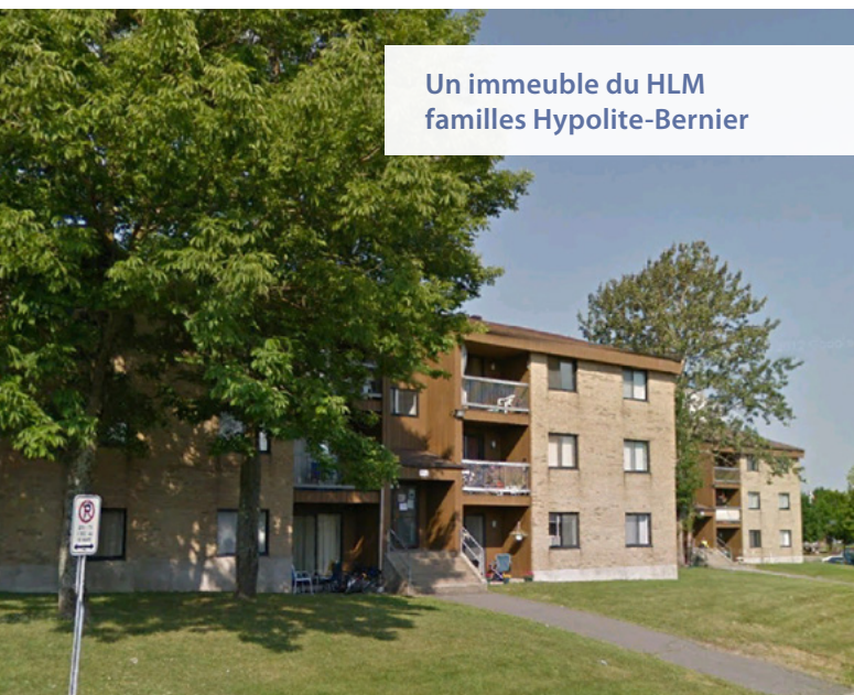
Un immeuble du HLM familles Hypolite-Bernier

Avec ses 144 147 habitants, Lévis est la municipalité la plus peuplée de la région de Chaudière-Appalaches (MAMROT, 2016). L'Office municipal d'habitation de Lévis (OMH Lévis) possède également un parc de logement important (899 unités), composé de 316 appartements pour les familles, 577 pour les personnes âgées et 6 pour les personnes seules (SHQ, 2016). Répartis sur 24 sites à travers de la ville, la majorité des unités sont situées dans des immeubles à multilogements (OMH Lévis, 2016). Bien que l'ensemble des appartements de l'OMH Lévis ait été considéré dans l'analyse, ce fascicule décrit plus spécifiquement la réalité du HLM Hypolite-Bernier (HB) (48 unités) et du HLM Place Renaissance (PR) (54 unités), composés surtout de familles (OMH Lévis, 2016). Ces deux ensembles de logements ont été choisis comme terrain d'enquête puisqu'ils ont tous deux bénéficié de projets reliés à l'Entente.